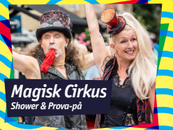
Magisk Cirkus Shower & Prova-på

P4 Nästa Final • Nationaldagsfirande • Tivoli • Marknad Gummibåtshäng • Cruising • Prova-på-aktiviteter Klubb Under Stjärnorna • Lekland • Falukorvsrace Utställningar • Dansbana • Mikrobryggerifestival Aktiviteter på Åbryggan • Food trucks • Kanotrace Och mycket annat skoj!